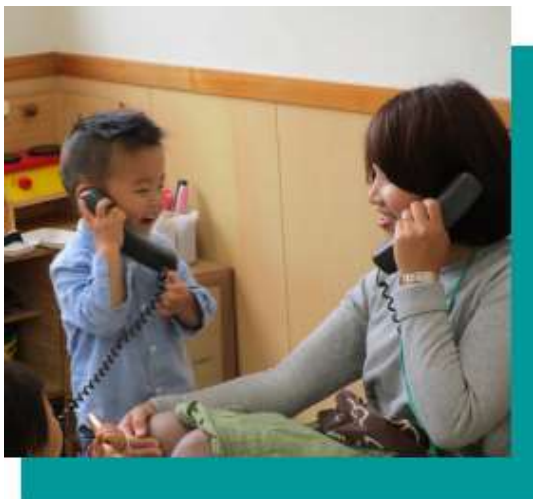
愛隣幼稚園の子育て支援（園庭・園舎開放）